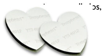
YSI 4012 Mini-Tempheart Shields

Provistas de conectores dorados-plateados las sondas YSI 400AC resisten a las sustancias químicas estandar y a los desinfectantes. Garantizadas por 100 ciclos de autoclave o 6 meses.