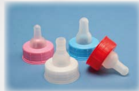
Sin ningún tipo de olor ni sabor.