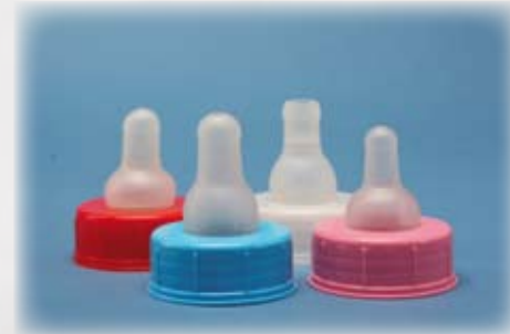
Una buena y cómoda sujeción en la boca del bebé.